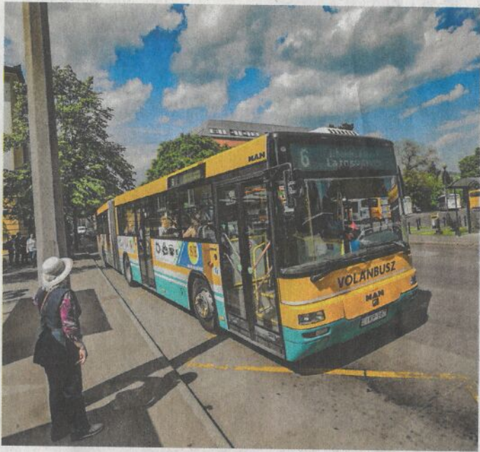
A helyi járatokra szóló bérletekkel gond adódik

A VOLÁNBUSZ Zrt. előtt is ismert probléma a jegyértékesítő gépek által kiadott bérletjegyek olvashatóságának romlása az idő előrehaladtával,